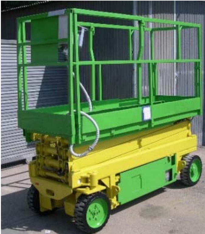
Modell IG 6084