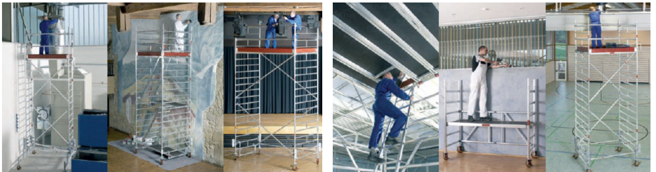
Anwendungsgebiete und Abbildung ähnlich.

Allgemeine Aufbau- und Benutzungshinweise umseitig.